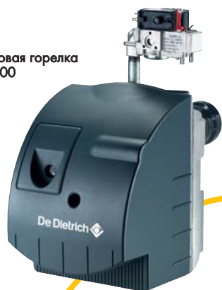
Газовая горелка G 100