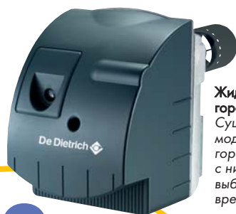
Жидкотопливная горелка M 100 Существует модификация - горелка Eco.NOx с низкими выбросами вредных веществ

Котел GT 120 оснащается новыми эффективными горелками, которые могут меняться в зависимости от типа используемого топлива. То есть, если Ваше жилище подключено к газовой сети, Вы очень легко можете заменить жидкотопливную горелку на газовую. Эти горелки с низкими выбросами NOx гарантируют качественное сгорание топлива, ограничивая выбросы вредных веществ. И, наконец, работа котла GT 120 практически бесшумна.