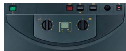
Панель со встроенным управлением водонагревателем для ГВС.

Котел GT 120 может быть оснащен 3 панелями на выбор. Стандартная панель (1) обеспечивает комфорт отопления и горячего водоснабжения. Панель Easymatic (2) поставляется с блоком дистанционного управления. Он представляет собой простой и ясный модуль, который устанавливается на панели котла, но может быть также установлен на держатель в жилом помещении. Это простое и рациональное решение. Наконец, панель DIEMATIC 3 (3) - самое технически совершенное решение. Блок дистанционного управления - диалоговый модуль заказывается дополнительно. Данная панель способна управлять всеми типами отопительных установок (нагрев бассейна, подключение солнечных коллекторов, каскад...)