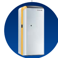
GTU 1200 V

высота 1475 ширина 600 глубина 1244 макс. (160 л) глубина 1386 макс. (250 л) 394 кг макс.